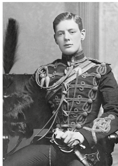
► WINSTON CHURCHILL TIJDENS ZIJN PERIODE OP HARROW.