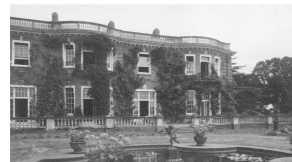
► HUIZE BYSTOCK IN EXMOUTH.