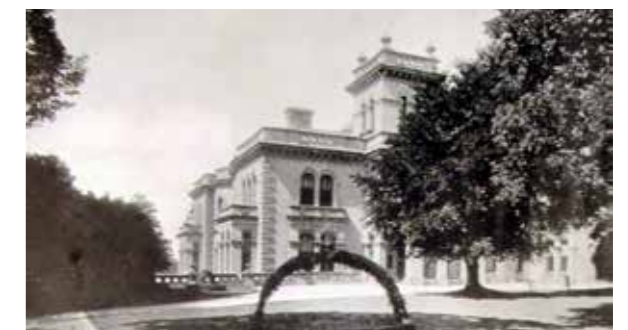
► HUIZE MARLEY IN EXMOUTH.