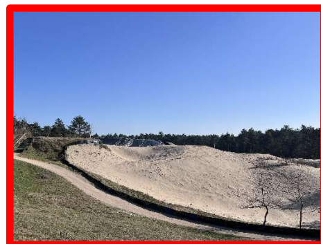
H11 | rechts voor afslagen H12