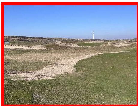
H10 | ca. 160 m van green links